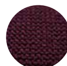
ツイード ボルドー

再生ペット素材の特性で撥水性が極めて向上し、汚れを寄せ付けず、防音効果、断熱効果、耐久性にも優れています。