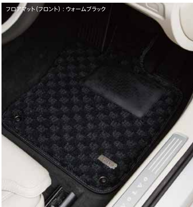
フロアマット(フロント)：ウォームブラック

毛足の長いカット＆ループ織りのボリューム感が車内に静寂をもたらし、超快適な空間を満喫いただける最高級タイプです。