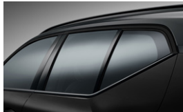
グロッシーブラック・トリム (サイドウィンドー・トリム / インテグレートド・ルーフレール)