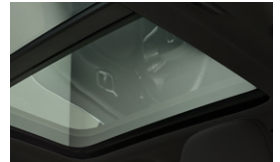
チルトアップ機構付 電動パノラマ・ガラス・サンルーフ