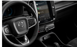
テイルード・シルクメタル・ スポーツステアリングホイール / カッティングエッジ・アルミニウム・パネル