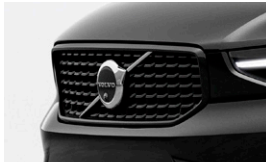
グロッシーブラック・ フロントグリル (格子状グリル)